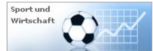
Tabelle und Einzelplatzierungen